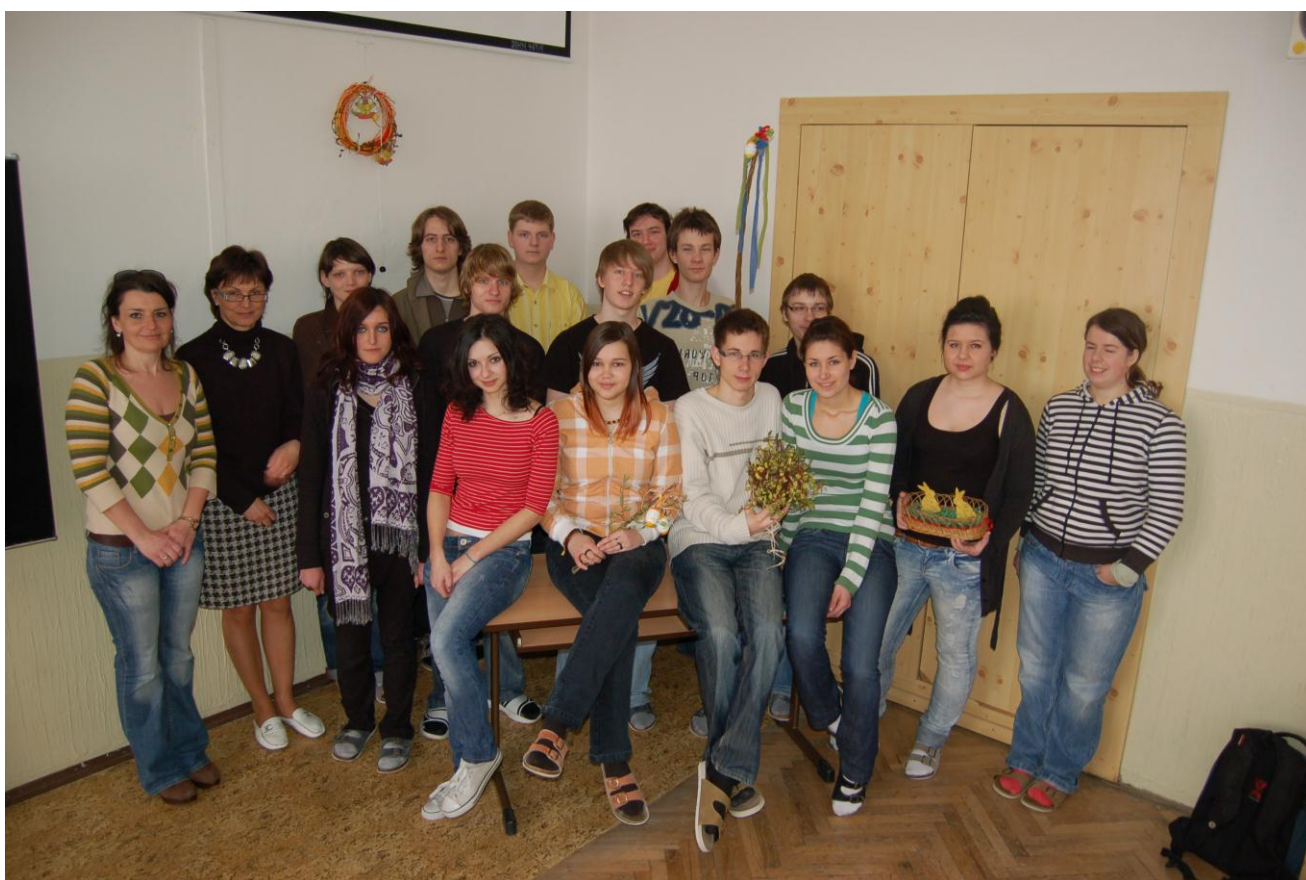
Redakční rada Průmkařin