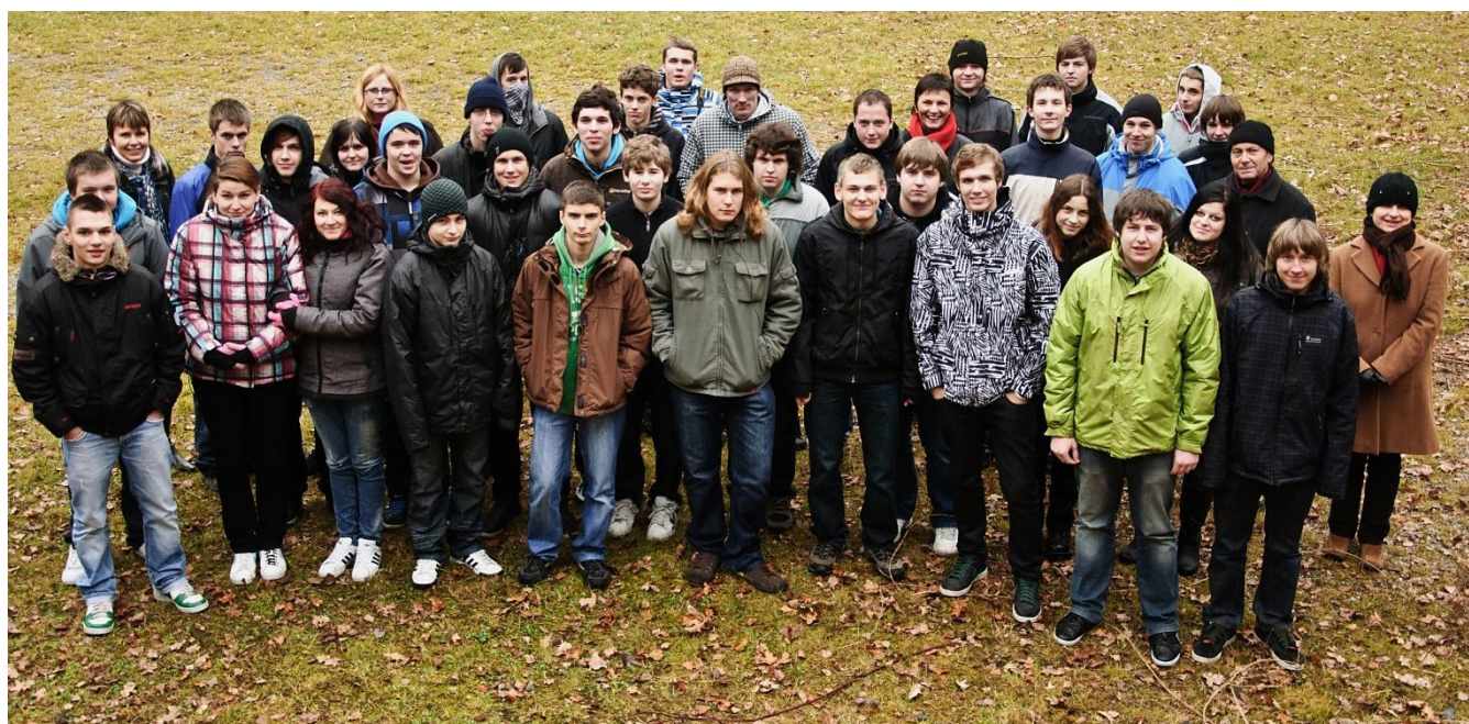
Společná fotka žáků SPŠ a VOŠ Písek a SOU Komenského Písek