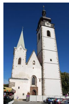
Zdeňka Müllerová, B2.I

Písecká věž patří k dominantám města Písku. Datum jejího založení je uváděn v roce 1489 podle nápisu nad západním portálem děkanského kostela. Koncem roku 1555 postihl Písek požár, při němž se roztavily původní zvony. Výjimečností této věže je fakt, že zde najdeme černou kuchyni (dodnes jsou na báni věže vidět zbytky původního komínu). V průběhu 18. století dochází k vybudování bytu věžníka v úrovni ochozu ve výšce 42,5 m. Roku 1805 dostala věž novou báň a nyní měří úctyhodných 71 m a při příjezdu do Písku je tato dominanta nádherně vidět ze všech světových stran.