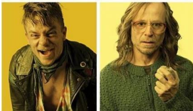
čtyři slunce film Bohdana Slámy