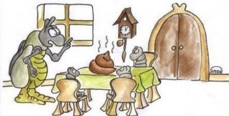
Jestlipak jste si vy špindírové umyli před jídlem ruce?