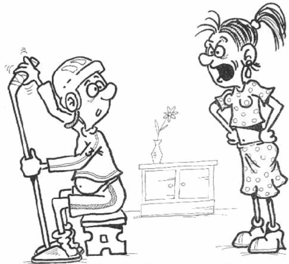
Hele, už nech toho tvrzení, že jsi na střídačce, a mazej se zapojit do hry. Je třeba vysát celý byt a umýt nádobí.