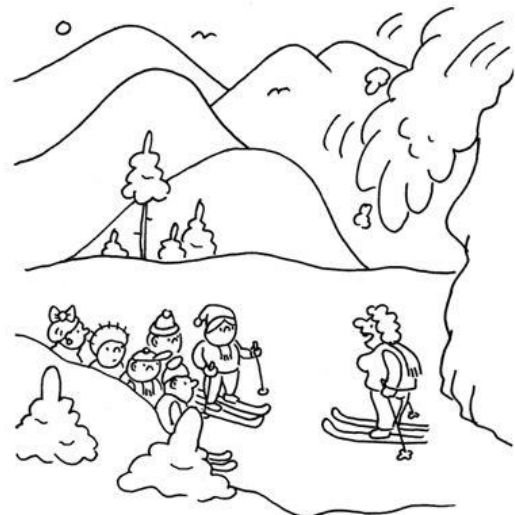
Jaká lavina, Nováku? Ale když už o ní mluvíš, jaké bys tam napsal i?