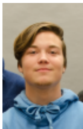
Ondřej Sellner zástupce fotograf